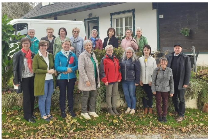
Der Ausflug der Frauenkreise ging heuer zum Laurenziberg nach Piregg und zur Essigmanufaktur in Koglhof.