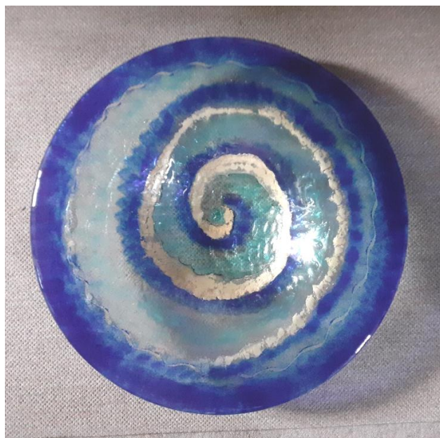
Das Pinggauer Taufbecken - 2008 angeschafft.

Kritiker sagen, die Christen werden als Schlafende getauft, so sind sie oft auch schlafende Christen. Es gibt aber im Laufe des Lebens viele Möglichkeiten die Taufe zu erneuern und bewusst Ja zu Christus zu sagen.